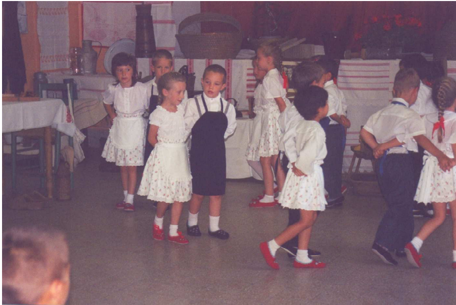
A mecsekjánosi óvodások műsora a „Mecsekjánosi múltja” című kiállítás alkalmából (2003)