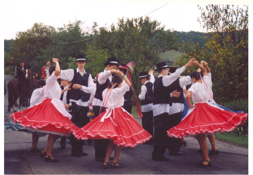
Szüreti felvonulás – A Hagyományőrző Néptáncgyűttes tagjai (2003)