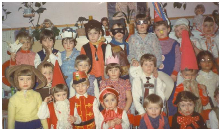
Farsangi jelmezbál 1984.