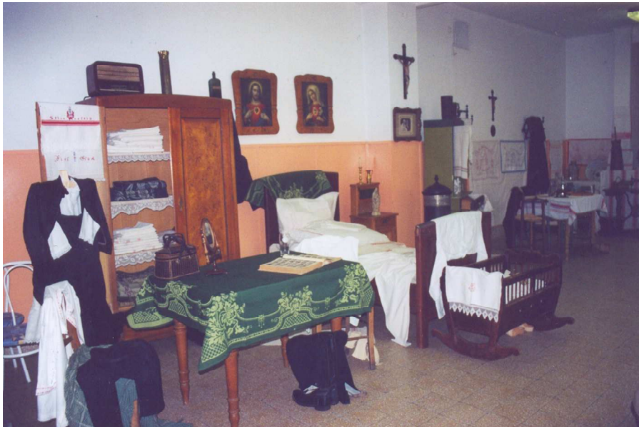
Egy darabka múlt... - Részlet a kiállításból