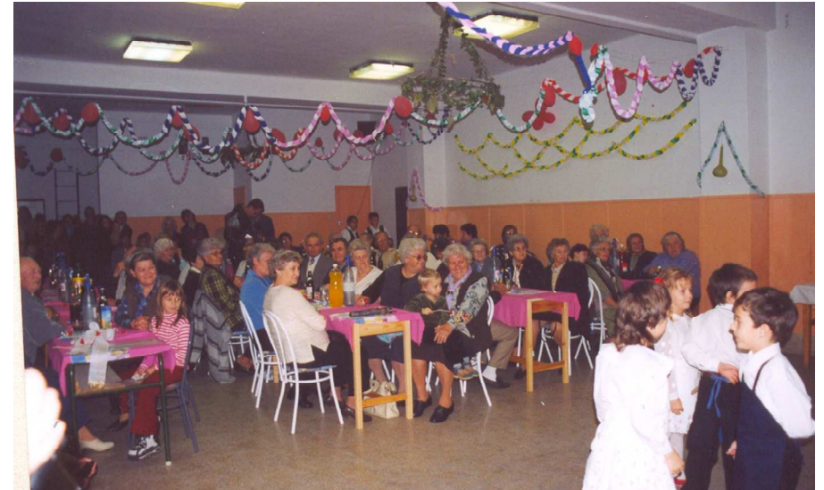
Idősek napi rendezvény 2003