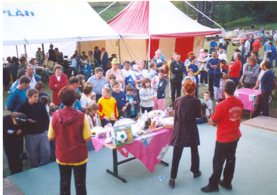
2002-es évi Falunapi rendezvényünk

Az egyesület programjai közé tartoznak az évente megrendezésre kerülő húsvéti játszóház, gyermeknap, adventi játszóház, falunap rendezvények, szüreti bál, farsangi bál, idősek napja, egészségügyi előadások, faluszépítő napok, költészet napja